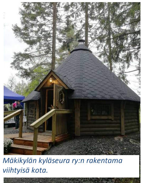
Mäkikylän kyläseura ry:n rakentama viihtyisä kota.

Valtakunnallinen Avoimet kylät -päivä 13.6.2020 toteutettiin poikkeuksellisesti verkossa. Tapahtumaan saatiin mukaan paljon sellaisia kyliä, jotka eivät olleet aiemmin mukana. Kuudestaan toiminta-alueelta oli ensikertalaisia mukana esittelemässä kyläänsä virtuaalisesti.